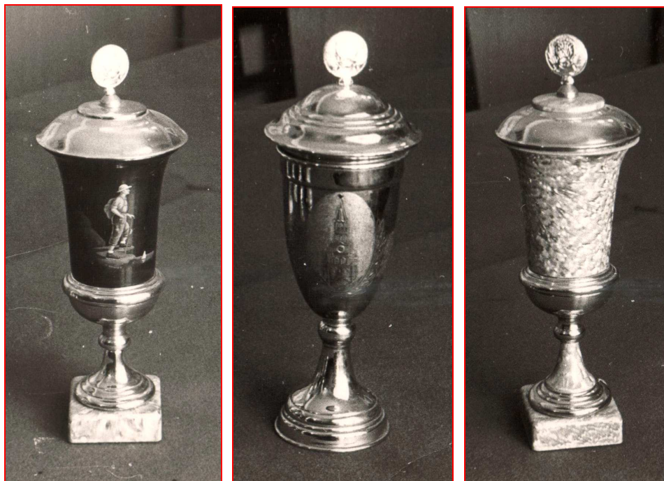
Кубки, завоёванные коллективом физической Фабрики им. Н.С.Абельмана