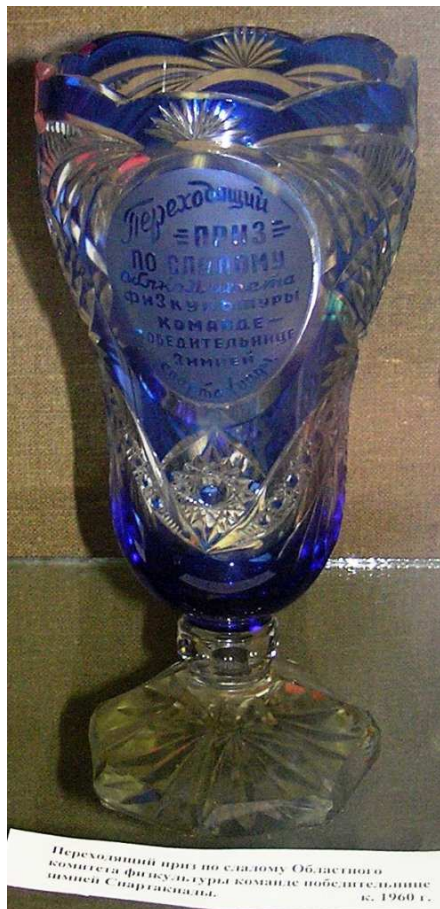
Переходящий приз по слалому облкомитета физкультуры зимней спартакиады (1960 г.) [в Ковровском музее]