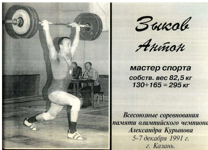
[«Тяжёлая атлетика. г.Ковров», 1998]