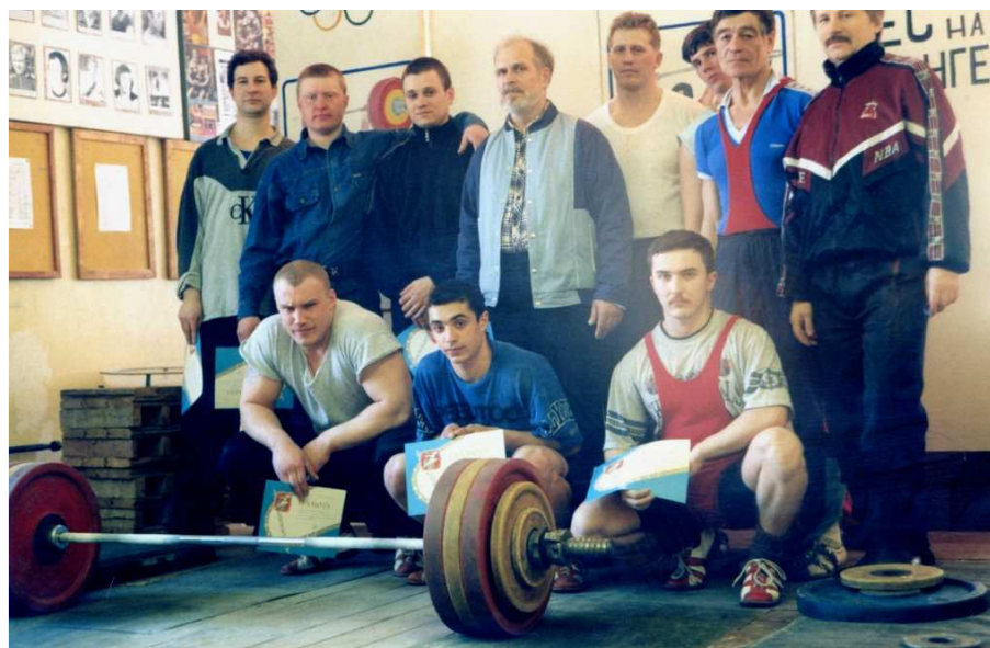
После соревнований