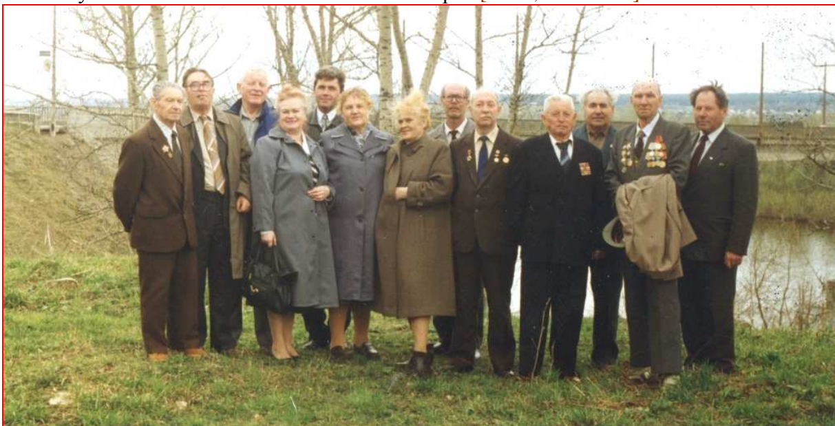
Ветераны ФКиС г.Коврова (7 мая 1997 г.)

Чалов Б.К.: «Я не отмечен высокими правительственными наградами, но память и любовь учеников заменяет мне их в полной мере» [«ЗТ», 5.08.1998].