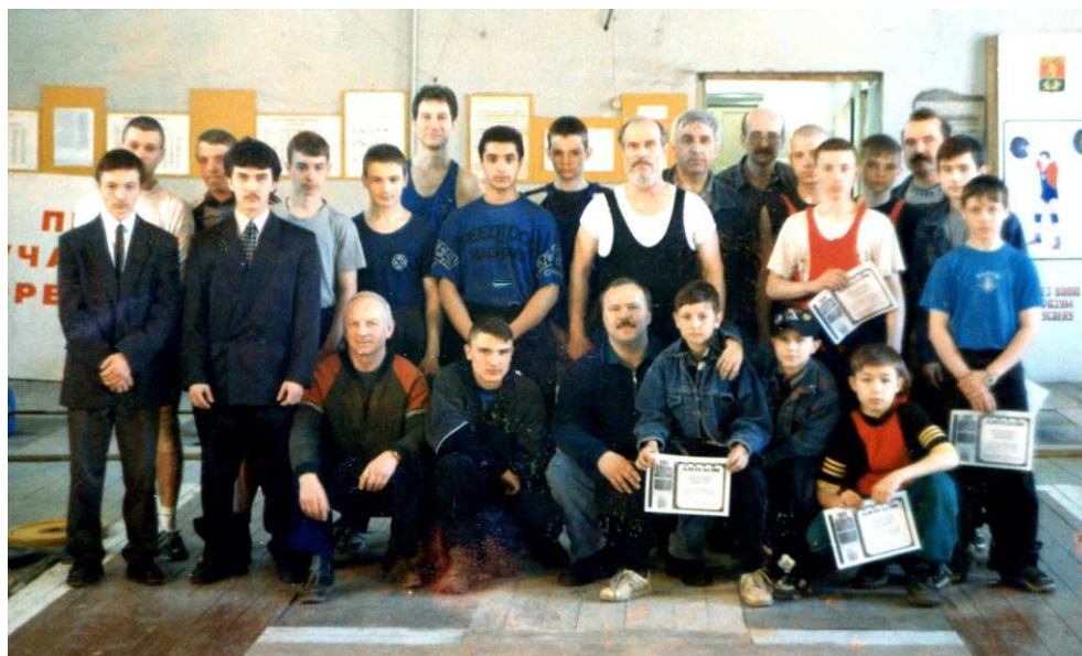
(ТУ №16)

2001 г. «С 3 по 8 мая 2001 г. в г. Жукове прошёл XVIII Чемпионат России среди спортивных клубов и коллективов физкультуры по тяжёлой атлетике . 58 команд, 317 спортсменов из 48 регионов, 12 мастеров спорта международного класса, чемпионы мира и Европы приехали померяться силой. Городской спорткомитет направил на турнир 6 штангистов секции-1 ФТА и судью.