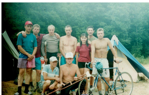
Летний биатлон в Пенкино