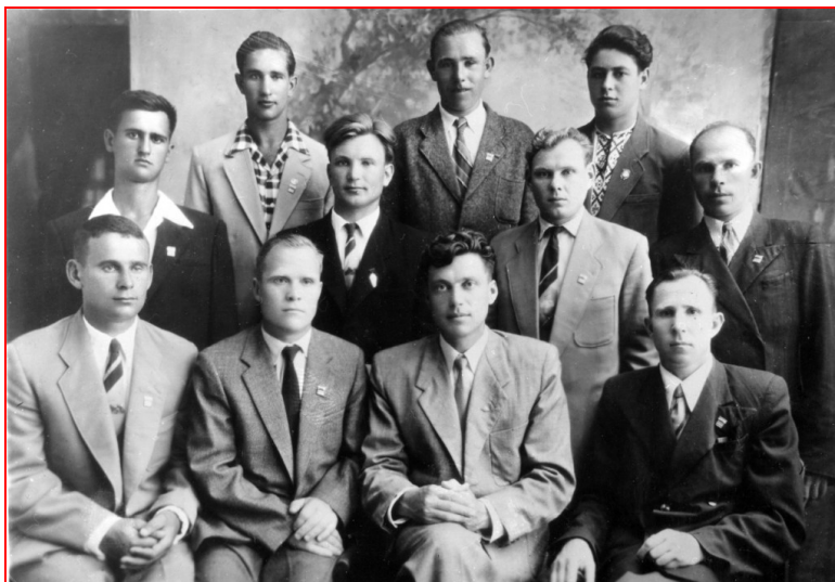
Ковровские мотогонщики (ЗиД) (1959 г.)

Ковровчане выступали в составе 2 команд – ДОСААФ и мотоклуба...» [«РК», 10.02.1959].