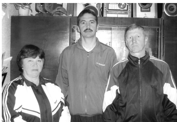
Учителя физической культуры школы №8 (Г.Егоркина, М.Королёв, М.Егоркин)