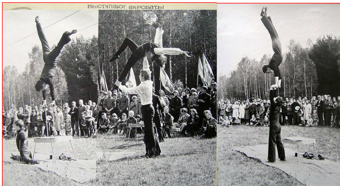
Выступление акробатов (1983 г.)