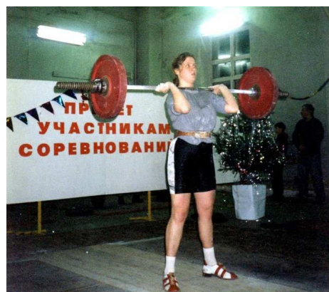
Мастер спорта РФ Е.Крапивина