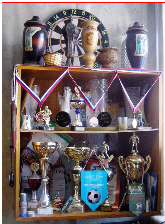
Последние награды спортсменов ДКиТ «Родина» (16.01.2015)