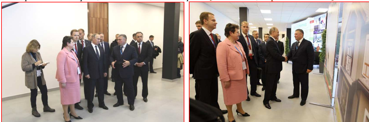
Посещение Президентом РФ В.В.Путиным Доброграда (г.Ковров, Доброград, 11.10.2016 г.)