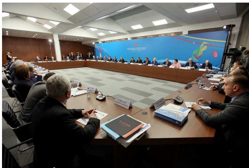
Доброград – основная площадка Форума «Россия – спортивная держава» (Доброград, 11.10.2016)

«11 октября 2016 г. Президент России Владимир Путин провёл заседание Совета при Президенте по развитию физической культуры и спорта. Мероприятие прошло в Доброграде в рамках VI Международного форума «Россия – спортивная держава».