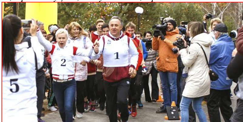
Символический забег (Доброград, 11.10.2016)

«11 октября 2016 г. в Доброграде в рамках Международного спортивного Форума «Россия – спортивная держава» в символическом массовом забеге приняли участие Министр спорта Виталий Мутко, известные на весь мир спортсмены Светлана Журова, Светлана Хоркина, Ирина Слуцкая, Бату Хасиков, Ирина Баталова.