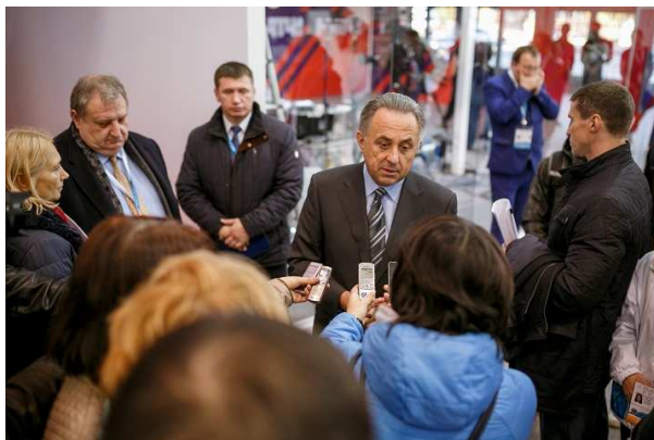
Доброград – основная площадка форума «Россия – спортивная держава» Министр спорта РФ В.Мутко (Доброград, 10.10.2016)

« Доброград мы выбрали как площадку, чтобы доказать регионам, что развитие спорта и поддержка физической культуры должны сегодня строиться на частно-государственной основе. Нельзя опираться только на государственные ресурсы.