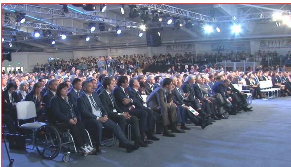
Пленарное заседание VI Международного Форума «Россия – спортивная держава», посвящённое теме «Спорт-2030. Программа будущего» (г.Ковров, Ледовый дворец «Ковровец», 11.10.2016 г.)

«Они по очереди выходили к микрофону и рассказывали про сегодняшний и завтрашний день спорта в России и мире» [11.10.2016, http://www.nnov.kp.ru ].