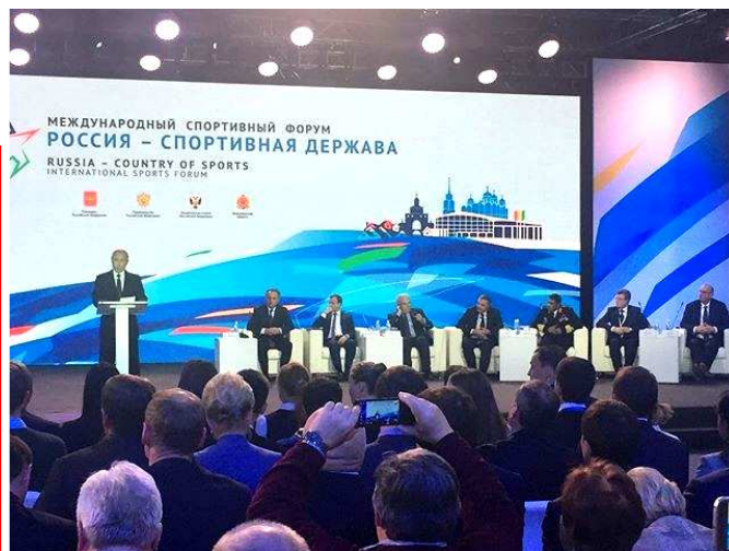
Выступление В.В.Путина на пленарном заседании VI Международного Форума «Россия – спортивная держава», посвящённого теме «Спорт-2030. Программа будущего» (г.Ковров, Ледовый дворец «Ковровец», 11.10.2016 г.)