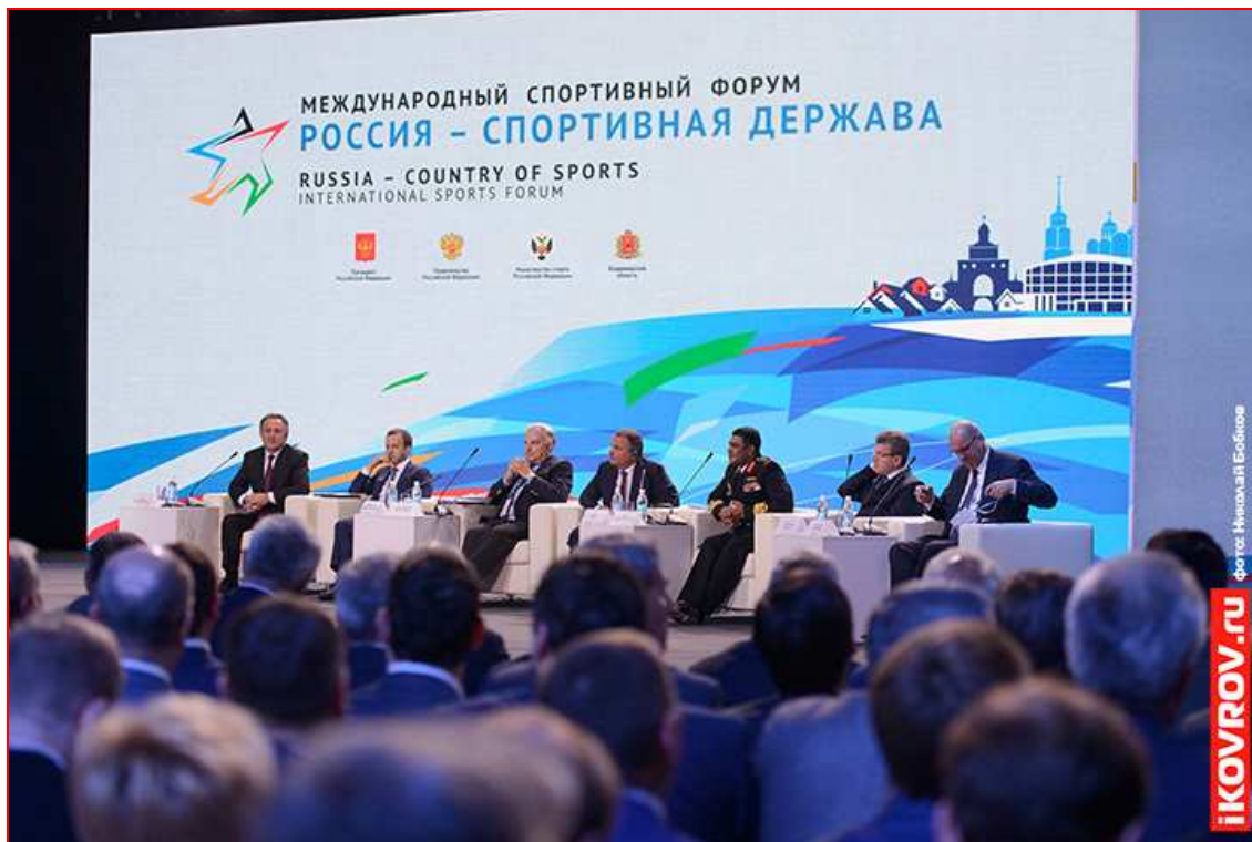
Пленарное заседание VI Международного Форума «Россия – спортивная держава», посвящённое теме «Спорт-2030. Программа будущего» (г.Ковров, Ледовый дворец «Ковровец», 11.10.2016 г.)