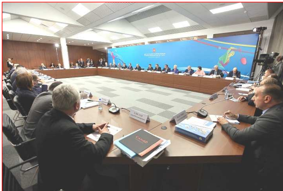
Заседание Совета при Президенте по развитию физической культуры и спорта (Доброград, 11.10.2016)