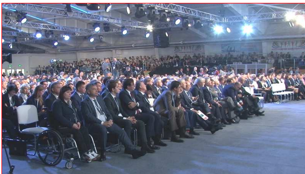
Пленарное заседание VI Международного Форума «Россия – спортивная держава», посвящённое теме «Спорт-2030. Программа будущего» (г.Ковров, Ледовый дворец «Ковровец», 11.10.2016 г.)