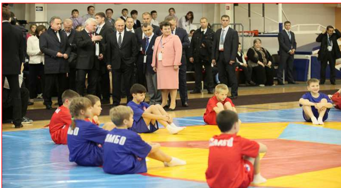
Посещение Президентом РФ В.В.Путиным ФОК «Молодёжный» (г.Ковров, ФОК «Молодёжный», 11.10.2016 г.)

«Потом Глава государства совместно с Губернатором Светланой Орловой посетил спортивный комплекс «Молодёжный» – один из центров проведения фестиваля «Дни самбо во Владимирской области» [13.10.2016, http://kovrovsegodnya.ru ].