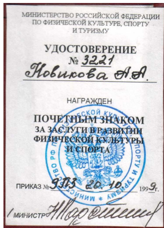
«За заслуги в развитии ФКиС»