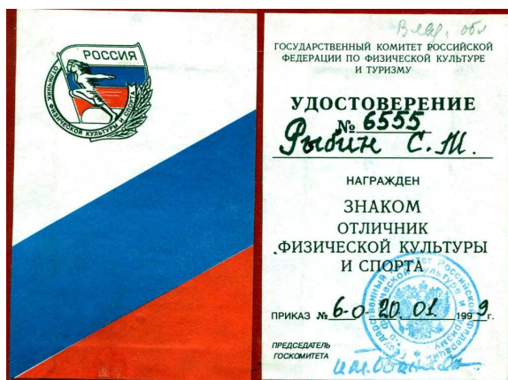
«Отличник ФКиС РФ»