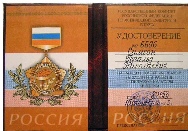
«За заслуги в развитии ФКиС»

- Спортивных мероприятий провели раза в два больше. Активно участвуем в областной спартакиаде, занимаем 3 место, уступая Мурому и Владимиру. Плавательный бассейн – лучший в области. На спортивные программы в бюджете нынешнего года заложено средств вдвое больше, чем в прошлом. Однако многие крупные предприятия, всегда помогавшие спорту, сегодня едва держатся на плаву. Скорее всего, городу передадут и малевский стадион» [«ЗТ», 8.08.2003]. – «Всё хорошо, прекрасная маркиза!!!»