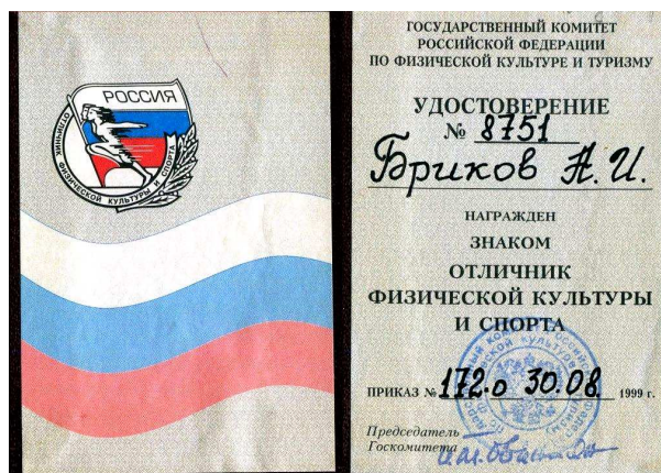
«Отличник ФКиС РФ»