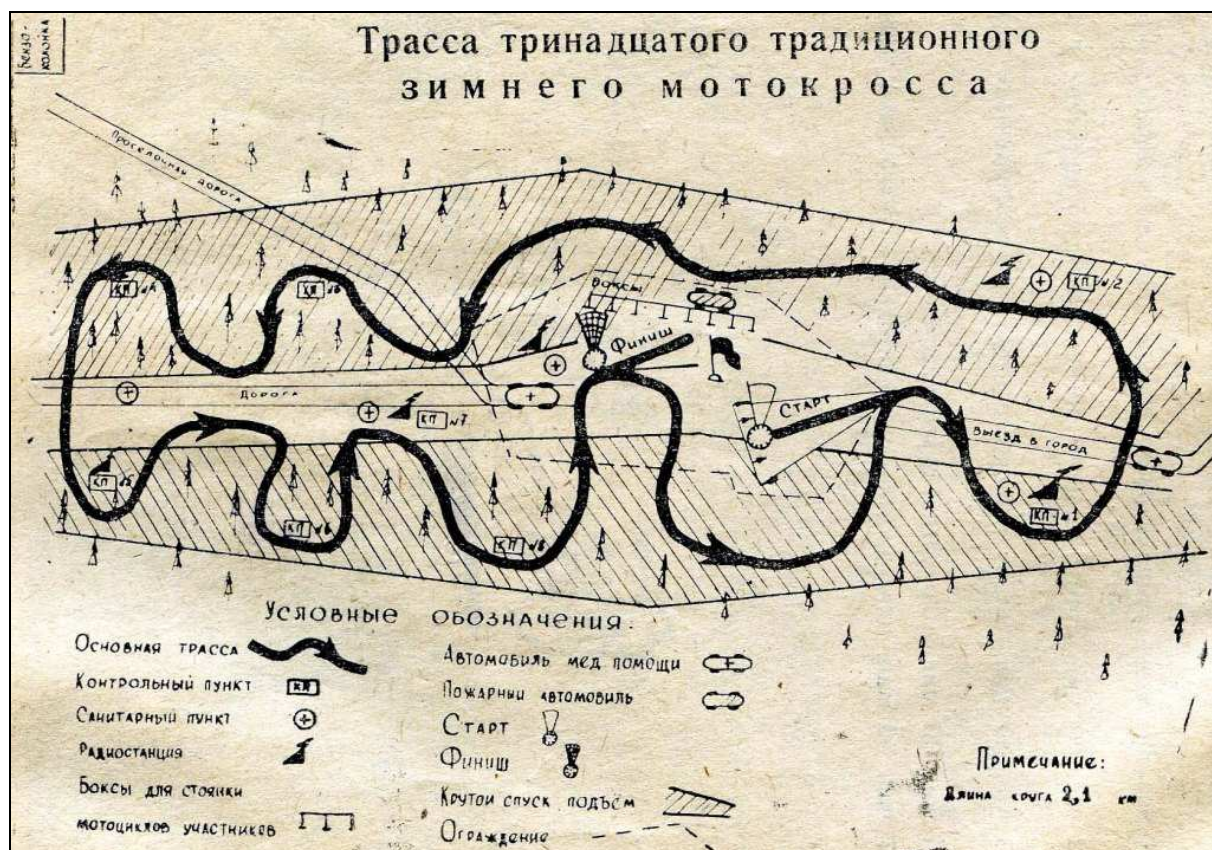
Трасса Ковровских зимних мотокроссов на «Шириной горе»