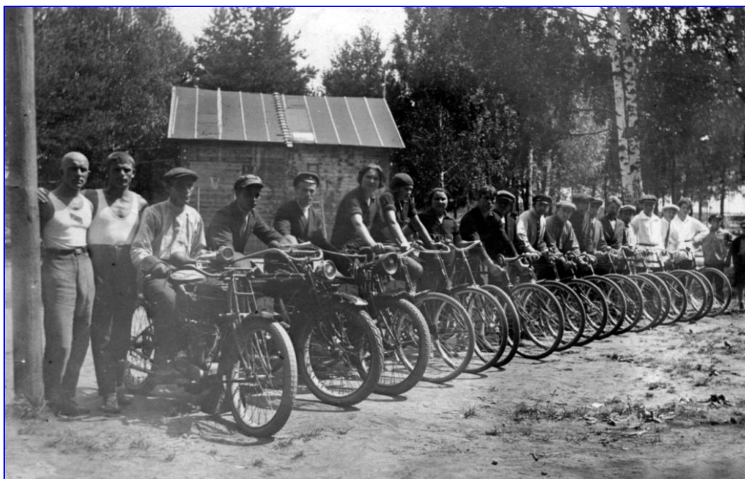
Первая МОТО-велосекция пулемётного завода ( Зид ) ( 1929 г.) Инструкторы физкультуры: С.Сорокин и Дмитриев [ В.М.Седов, 1967 ]

Но когда станут доступными хотя бы довоенные газеты, эти «белые пятна» превратятся уже «серые пятна» и т.д.