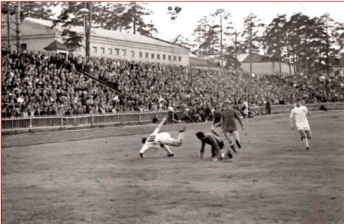
Вот сколько зрителей было на трибунах стадиона !!! (1960-е гг., класс «Б»)