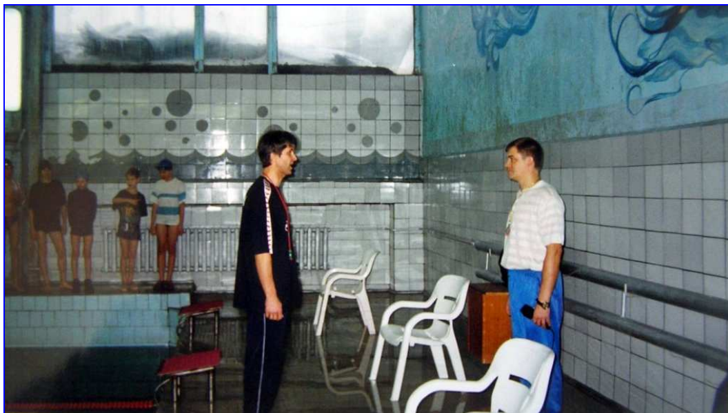
Соревнования по плаванию (03.2001)