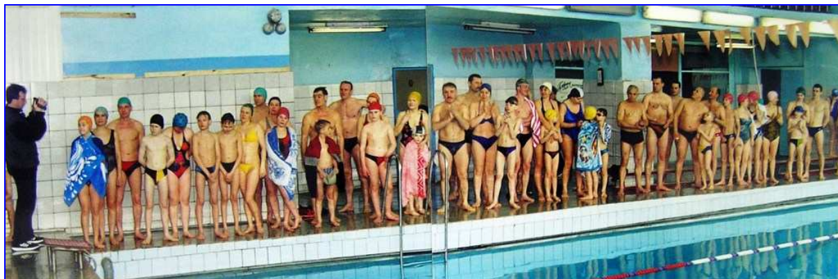
Соревнования «Мама, папа, я – спортивная семья» (23.03.2002 г.)