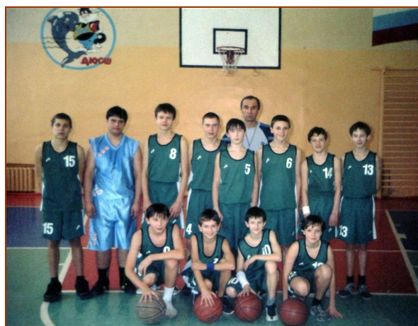
Отделение баскетбола (2000-2016 гг.)