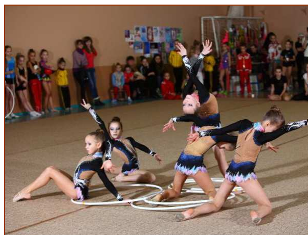
Отделение художественной гимнастики (2002-2019... гг.)