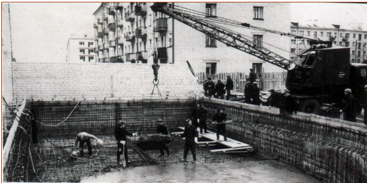
Бетонирование чаши бассейна (1968 г.) (прямо – 44-й дом по ул. А. Лопатина)