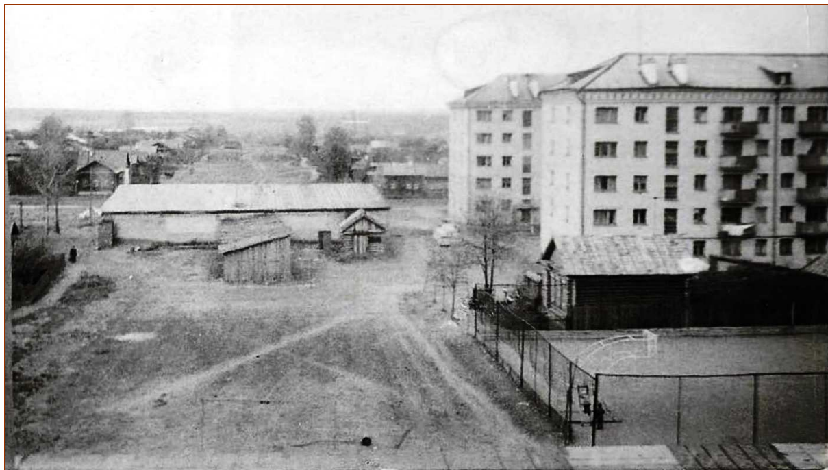
«Замороженная стройка» Дома физкультуры ВНИИ «Сигнал» (1966 г.)

Дом физкультуры с плавательным бассейном «Сигнал» был построен, а 15-й микрорайон города («сигнальский») всегда был образцовым в Коврове.