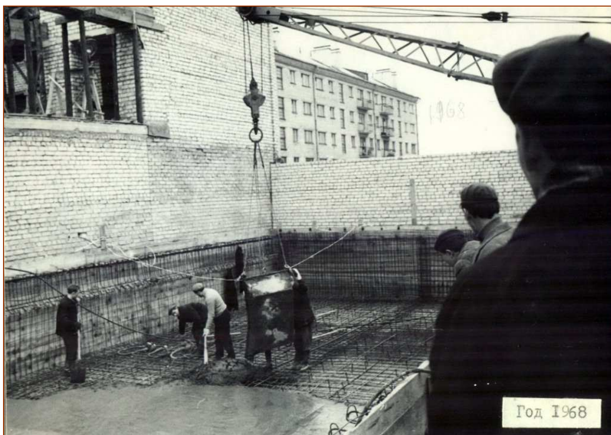
Бетонирование чаши бассейна (1968 г.) (слева – 46-й дом по ул. Лопатина)

Еле ноги унесли в связи со строительством бассейна... Надо было открывать счёт в банке для его строительства. А такой строчки в бюджете предприятия не было... Благодаря пониманию военпредов, мы построили бассейн.