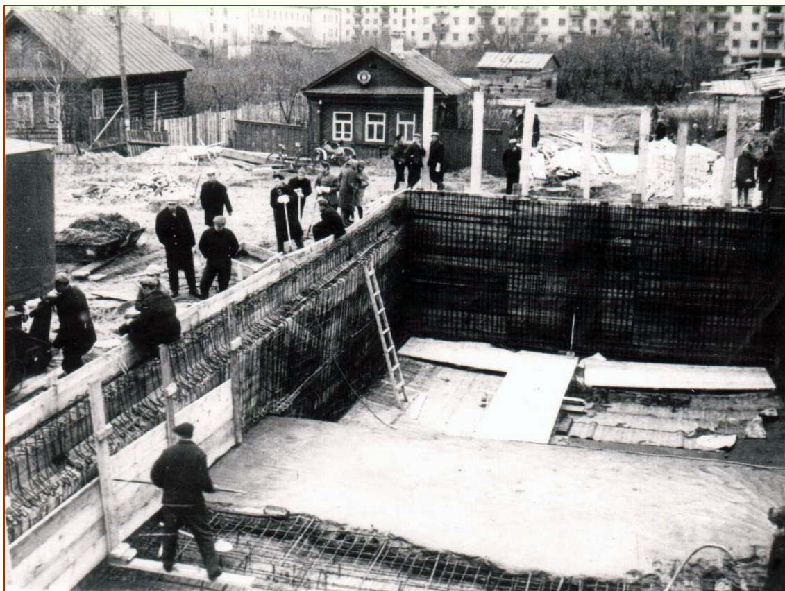
Строительство чаши бассейна (деревянные дома по ул.Коммунистической) (1968 г.)